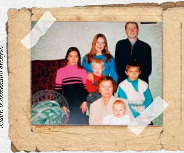
Tarp anūkų Lietuvoje